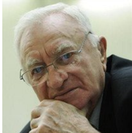
Thomas Toivi Blatt